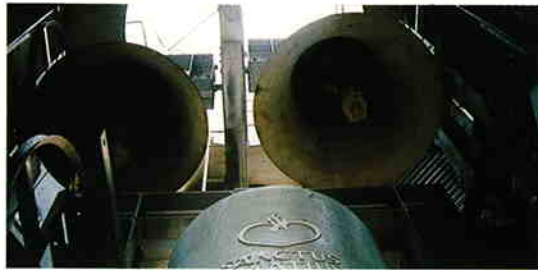
ソフィア・テレジア・イグナチオの3つの鐘

皆さんも是非、鐘が告げる平和の音を聞きに足を運んでみてください。『境内』での会話が困難になるほどの大音量です。また、美しくライトアップされた鐘楼は一見の価値あり！One編集部イチ押しです。