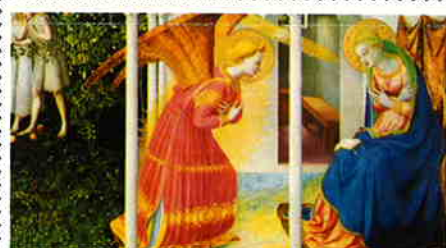
15. Fra Angelico. The Annunciation.